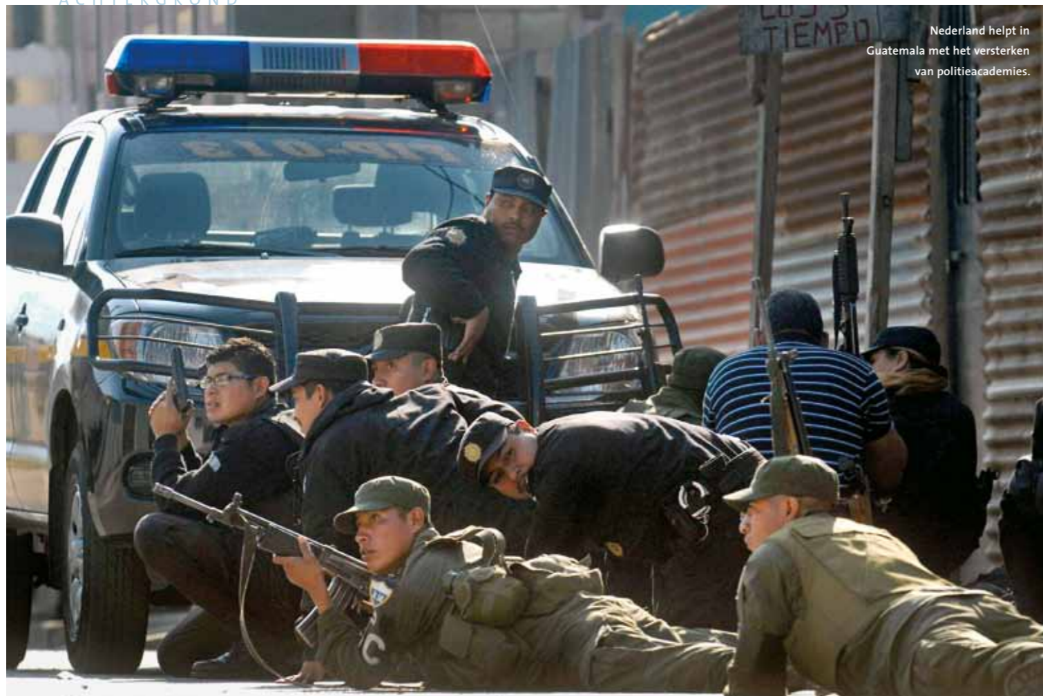
Nederland helpt in Guatemala met het versterken van politieacademies.