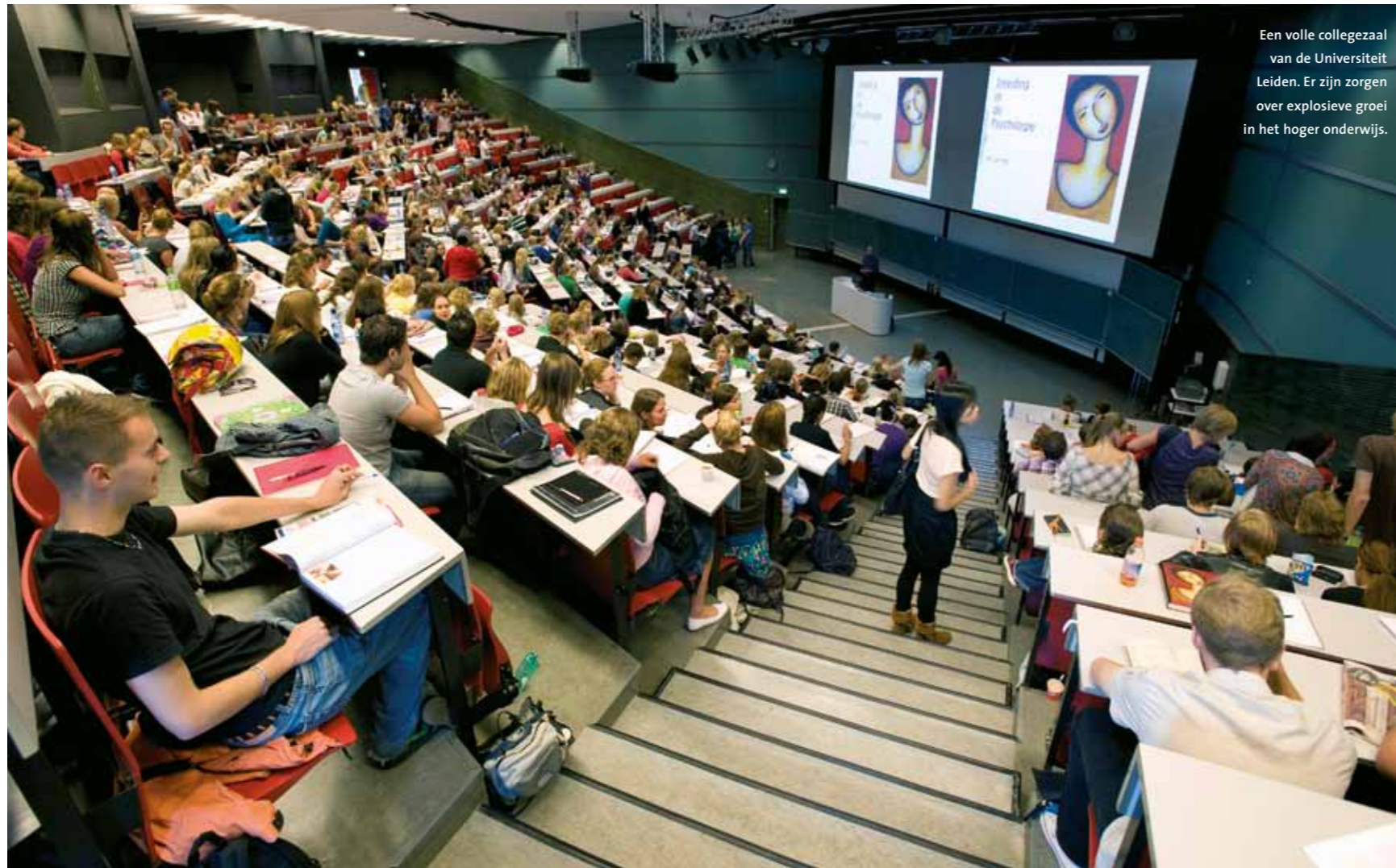
Een volle collegezaal van de Universiteit Leiden. Er zijn zorgen over explosieve groei in het hoger onderwijs.