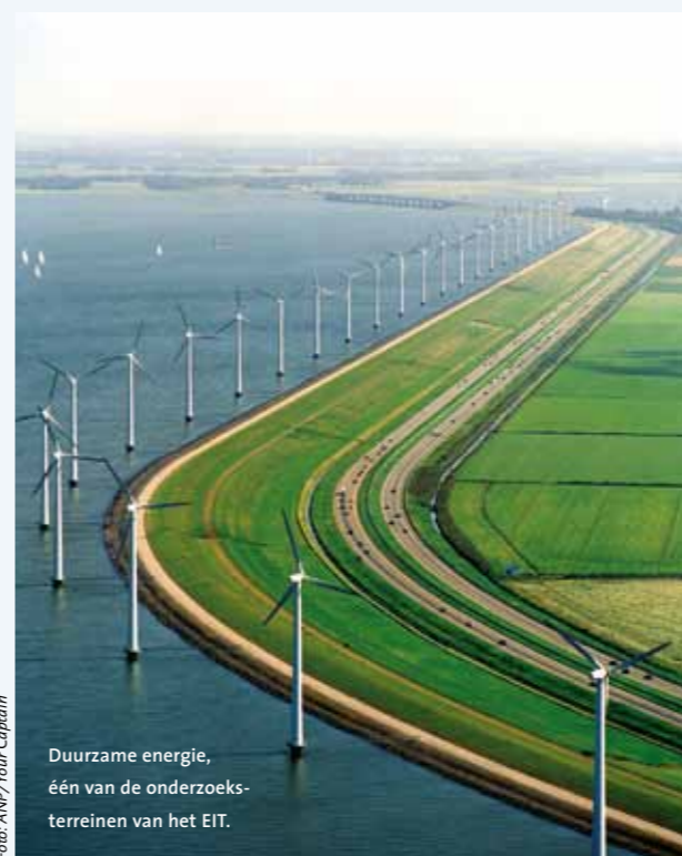
Duurzame energie, één van de onderzoeks-terreinen van het EIT.

Nederland is goed vertegenwoordigd in de Europese kennisgemeenschappen die innovatie in Europa een boost moeten geven. Het Europees Instituut voor Innovatie en Technologie (EIT) heeft de samenstelling van de nieuwe kenniscentra bekendgemaakt. Nederland is als een van de weinige landen vertegenwoordigd op alle drie de onderzoeksterreinen (ict, klimaat en duurzame energie). Deelnemende kennisinstellingen en bedrijven zijn onder meer de drie TU's, de universiteiten van Groningen, Utrecht en Wageningen, Philips, TNO, Shell en de Gasunie.